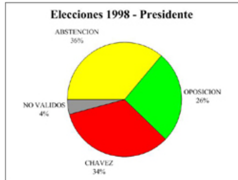
Figura 1. Elecciones Presidencia de la República de Venezuela. Elaborado con datos tomados de las actas del Consejo Nacional Electoral, Caracas, 1998.